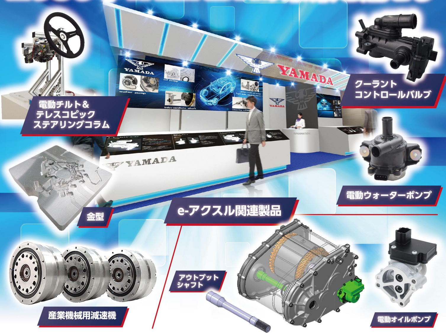
電動チルト& テレスコピック ステアリングコラム